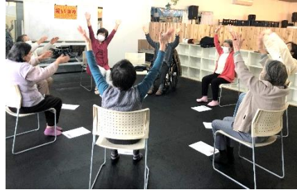
ラフターヨガ(笑いヨガ)