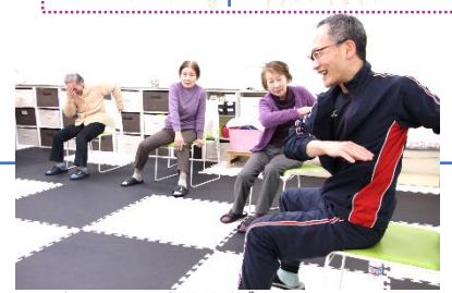
ファンクシヨナルエクササイズ

亀吉鶴楽舞会員で、 活動などの情報をお持ちの方が いらっしゃいましたら ぜひ事務局まで メールにてお寄せください！ 本紙やメルマガ等で ご紹介させていただきます いただくことがあります。