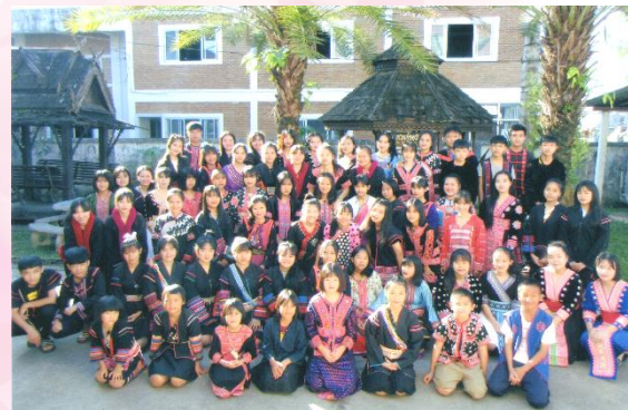
▲寮だけでなく図書室やホールなどの施設もあります

「さくらプロジェクト」は、タイ山岳民族の子供たちの教育支援を行なうNGOです。チェンライ市ナムラット地区でさくら寮を運営し、経済的理由などで勉強ができない子供達の教育支援活動を行っています。さくら寮の運営は、支援者の寄付金で賄っており、亀吉鶴楽舞からも寄付をしています。里親制度や支援金の振込みなどさまざまな方法があります。一緒に支援に参加しませんか？